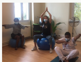
Atelier de psychomotricité