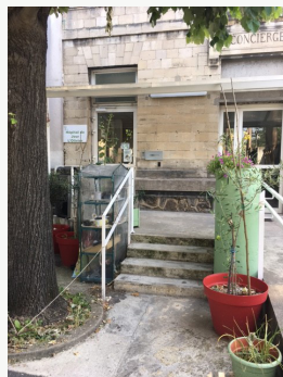
Entrée de l'HDJ