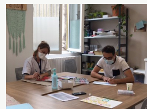
Atelier d'art thérapie