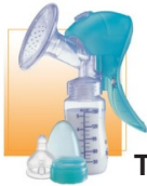
Tire lait manuel

Vous pouvez utiliser un tire lait manuel ou électrique.