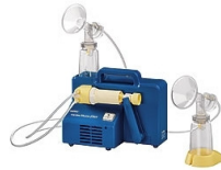
Tire lait électrique

Un tire-lait électrique est à votre disposition en maternité et au sein de notre service. Pour la maison, vous avez la possibilité d'en louer un.